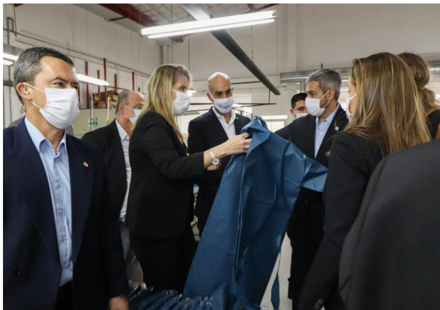
Tres millones de batas y tres mil empleos, gracias a Acuerdo Nacional

Confección de 3 millones de batas, que generaron 3.000 empleos