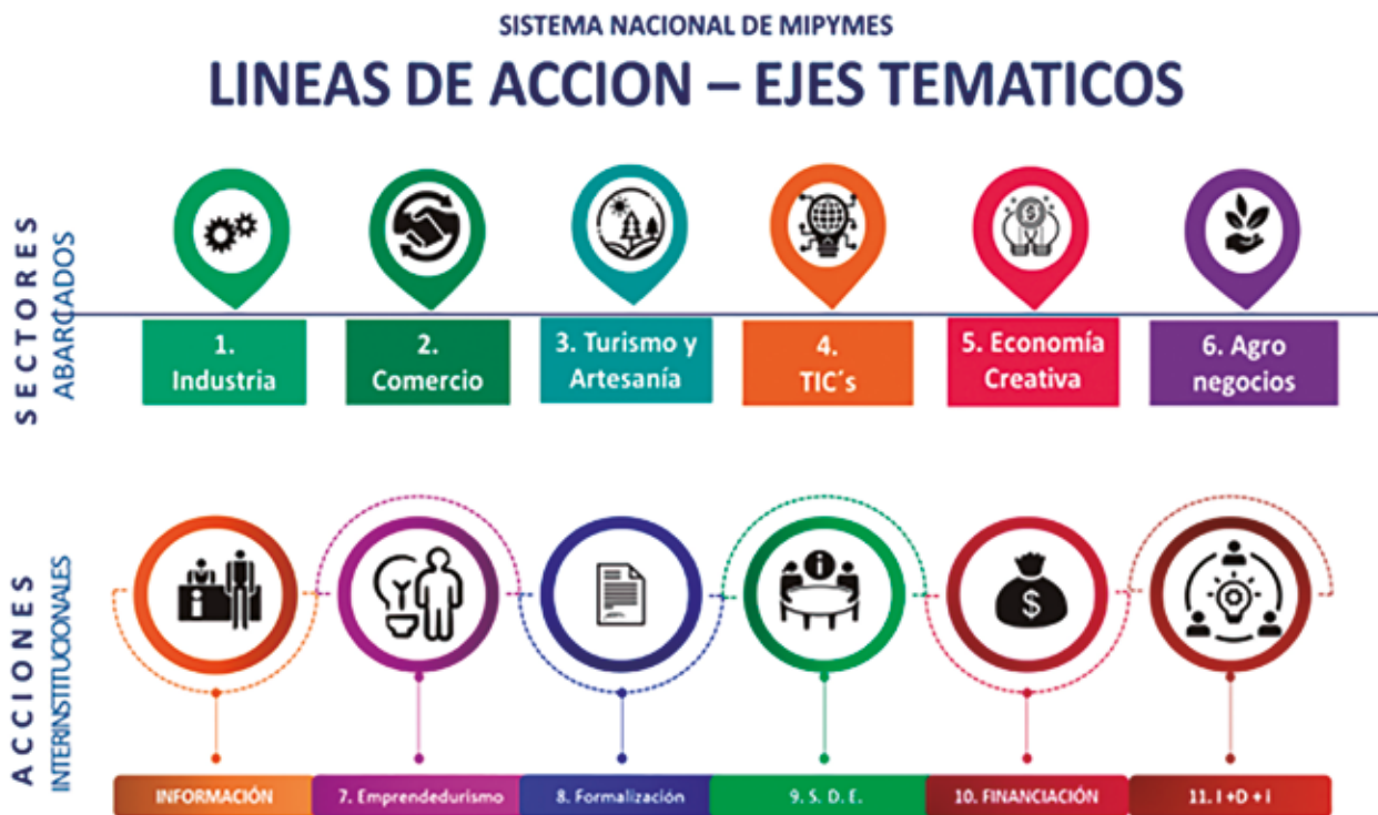
Figura N° 2: Mesas Temáticas del SINAMIPYMES